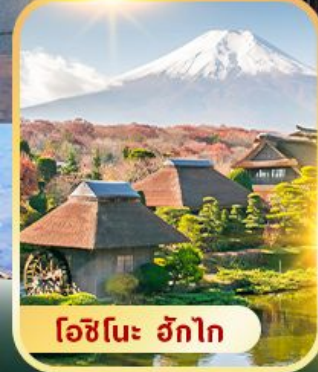
โอชิโนะ ะกิก