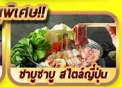
ชาบูชาบู สโตนญี่ปุ่น