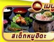
สเต็กหมูฮิดะ