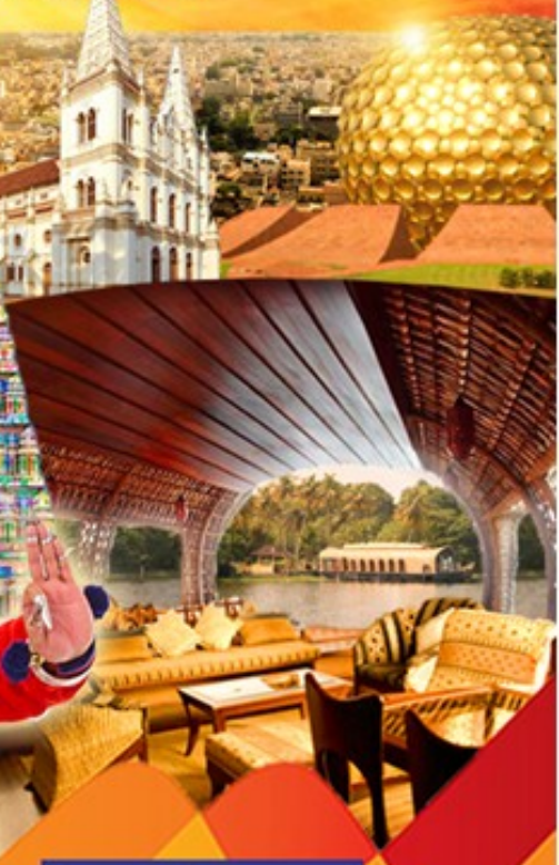
ล่องเรือซาฟารีเปรियาร์