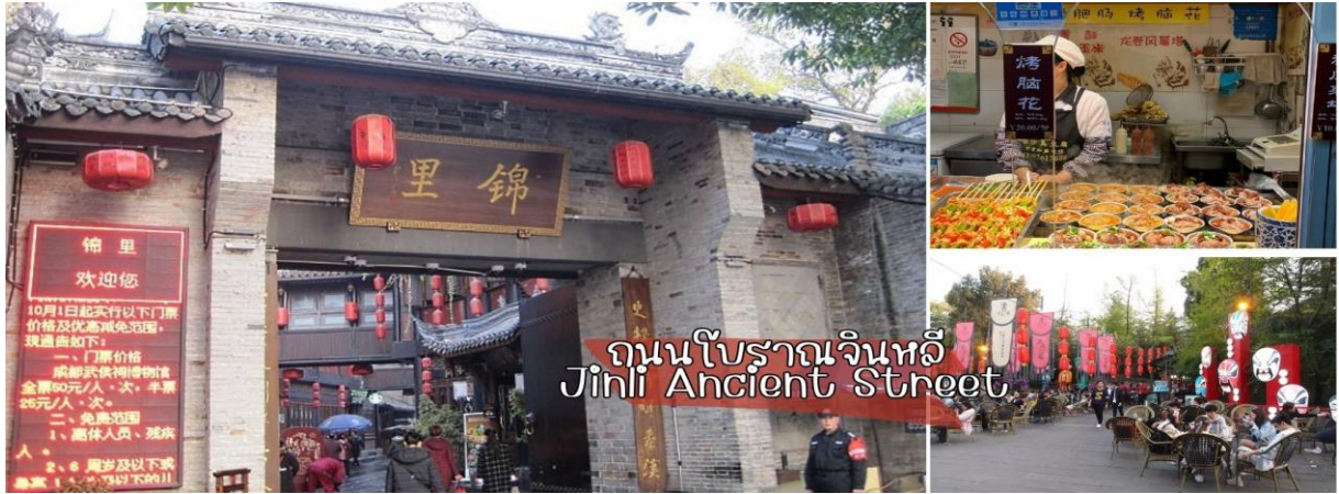
ถนนโบราณจินหลี่ Jinli Ancient Street

นำท่านเที่ยวชม ถนนโบราณจินหลี่ ถนนที่อยู่ติดกับศาลเจ้าสามก๊ก เป็นถนนวัฒนธรรม ตกแต่งแบบย้อนยุค เต็มไปด้วยกลิ่นอายของสามก๊ก ตัวถนนมีการตกแต่งอย่างสวยงาม มีของเก่าๆ มากมาย มีร้านอาหาร ร้านน้ำชา โรงเตี๊ยม โรงจั่ว และมีของที่ระลึกเกี่ยวกับสามก๊กขายเยอะมาก ร้านอาหารหลายร้านตกแต่งเป็น เล่าปี กวนอู เตียวหุย มีของกินข้างทางอร่อยๆ