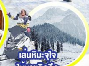
เล่นหิมะ-จ๊ว ให้หายคิดถึง