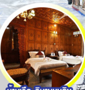
บ้านเรือ..วิมานบนดิน