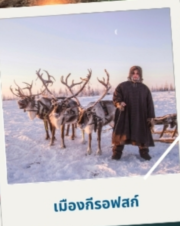
เมืองก็รอฟสค์