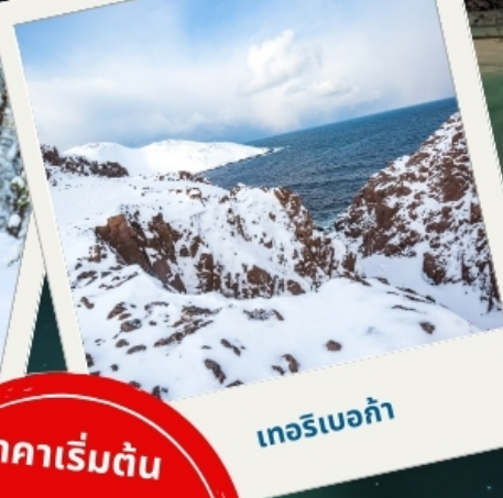
เทอริเบอก้า