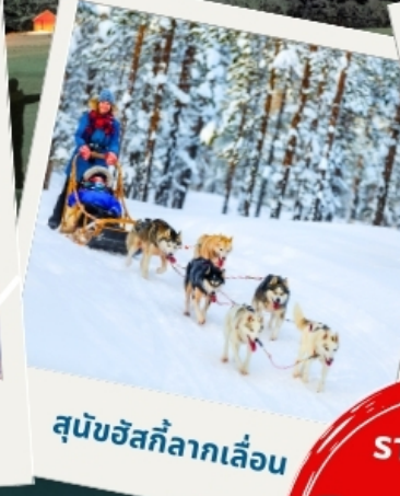
สุนัขฮัสกีลากเลื่อน