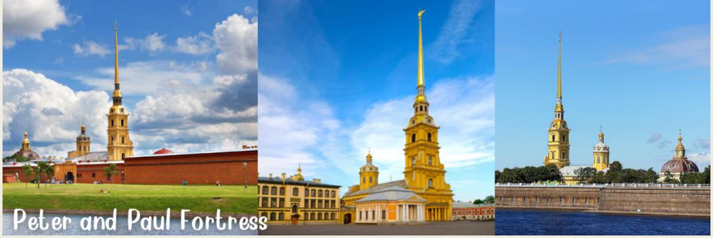
Peter and Paul Fortress

กลางวัน 📍 รับประทานอาหาร ณ ภัตตาคารท้องถิ่น นำท่านชม บ้อมปีเตอร์ แอนด์ ปอลด์ (Peter And Paul) เป็นสิ่งก่อสร้างแรกสุดของเมือง St Petersburg สร้างในปีค.ศ 1703 เป็นอนุสรณ์ชัยชนะสงครามเหนือสวีเดน ด้วยศิลปะแบบบารอกเพื่อใช้เป็นบ้อมปราการในการป้องกันข้าศึกกรูกราน ตั้งอยู่บน เกาะวาซิลเยฟสกี (Vasilievsky Island) ลักษณะเป็นรูปทรงหกเหลี่ยม กำแพงเป็นหินก่ออิฐ ส่วนวิหารปีเตอร์ แอนด์ ปอลด์ (Peter-and-Paul-Fortress) เริ่มสร้างขึ้นเมื่อปีค.ศ 1712 ด้วยการ ออกแบบของ DomennicaTrezzini สร้างเสร็จในวันที่ 29 มิถุนายน ค.ศ 1733 ตั้งชื่อวิหารแห่งนี้เพื่อเป็นเกียรติแด่นักบุญปีเตอร์ และนักบุญปอลด์เพื่อเป็นการเผยแพร่ศาสนา ความสูงของยอดแหลมคือ 122.5 เมตร ในอดีตเป็นสิ่ง ก่อสร้างที่สูงที่สุดของเมืองและห้ามสร้างสิ่งก่อสร้างใดสูงกว่า ภายในทำการตกแต่งด้วยศิลปะบารอกซึ่งนับว่าแตกต่าง กับโบสถ์คริสต์ออร์ทอดอกซ์ทั่วไปและวิหารแห่งนี้ยังเป็นที่เก็บพระศพของราชวงศ์โรมานอฟ เริ่มต้นจากพระเจ้าปีเตอร์มหาราชเป็นองค์แรก จนกระทั่งถึงกษัตริย์องค์สุดท้ายของราชวงศ์