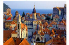
เมืองเก่า

** พักที่ Adria Hotel 4* หรือเทียบเท่า **