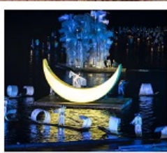
โซ่วหลิวซานเจีย