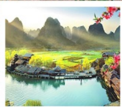
เมืองลิบแล