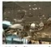
พิพิธภัณฑ์วิทยาศาสตร์