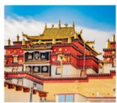
วัดชงจ้านหลิง

คุนหมิง • ยาดิง • เต๋อซิง • แชงกรีล่า 8 DAYS 7 NIGHTS