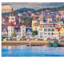
ท่าเรือประมงเหยียนโก๋

เรือลิวส์ / ย่านฮั่นเล่อฟาง / ถนนฮั่วจวิปา ท่าเรือประมงเหยียนโก๋ / ย่านฮงโหว่ 1920 / ถนนโบราณเฉาหยาง หอคอยกาลเวลา / ชายหาดจินซา / รูปปั้นปลาวาฬ / หาดทรายซาจื่อโหว่ หาดไซเบอร์ NO.3 / โรงงานเบียร์ชิงเต่า / โบสถ์ St. Emil ถนนคนเดินไต้ตง / สะพานจันเฉียว / จัตุรัส 54 / ห้าง MIXC