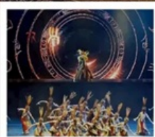
โชว์เว่ยซือ

เชียงใหม่ คลาสสิก ไนต์ (Shanghai Classic Night) หุบเขาเทวดาวังเซียนกู่ (ชมบรรยากาศกลางวันและกลางคืน) หมู่บ้านโบราณหวงหลิ่ง (รวมกระเช้าไปกลับ) สะพานกระจก ถนนโบราณกุนซี / โชว์การแสดงเว่ยซือ / หมู่บ้านโบราณเจียงชาน ถนนหวยไห่ (ร้านกระเป๋าสองมอนต์) / เช็กเมนู 3 ตึกใหญ่แห่งเชียงใหม่ Tian An 1,000 Trees / North Bund Green Land / ถนนอู่กิง