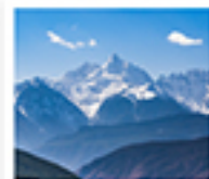
ภูเขาหินปะโพหม่าง