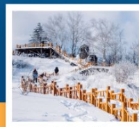
เขาเกาะหญ่า