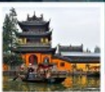
หมู่บ้านโบราณซูเจียเจียว

สวนสนุกยูนิเวอร์แซลปักกิ่ง / สวนสนุกเซี่ยงไฮ้ดิสนีย์แลนด์ / หมู่บ้านโบราณซูเจียเจียว ซินห่อไข่มุก / ลอดอุโมงค์เลเซอร์ / หาดไว่ทาม / จิตรกรรมอันยิ่งใหญ่ พระราชวังโบราณคู้กง / กำแพงเมืองจีนด่านจหยงทวน สนามกีฬาโอลิมปิกปักกิ่ง / ถนนโบราณเฉียนเหมิน