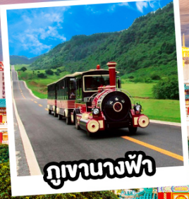
ภูเขาฉางฟ้า