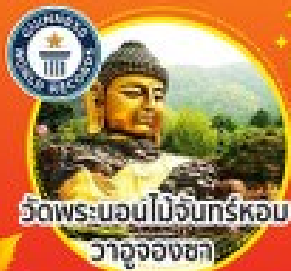
วัดพระบ่อนไม้จันทร์หอม วาจุงองชกา