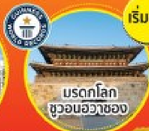
มรดกโลก ซูวอนฮวาซอง