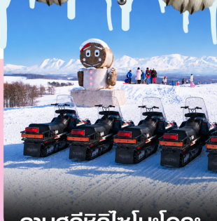
ลานสกีซึกิไซโนะโอกะ