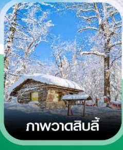
ภาพวาดสีบลู