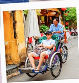
รถสามล้อ Cyclo