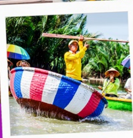
เรือกระดิง

ดานัง เว้ ฮอยอัน พักบนบ้านฮิลล์ 1 คืน เที่ยวครบเวียดนามกลาง 4วัน 3คืน