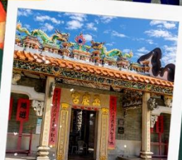
วัดปึกไต่