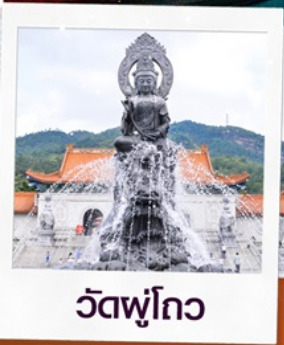
วัดฟูโกว