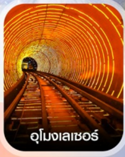
อุโมงเลเซอร์

✈️ คอนเฟิร์มออกเดินทาง ✈️ ทุกพีเรียด 2 ท่านขึ้นไป