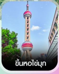
ขึ้นหอไข่มุก