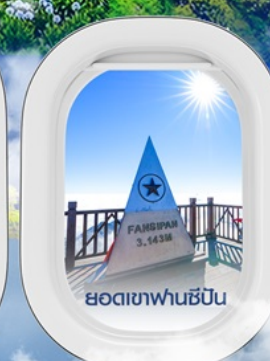
ยอดเขาฟานชีปิน

✈️ คอนเฟิร์มออกเดินทาง ✈️ ทุกพีเรียด 2 ท่านขึ้นไป