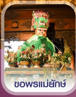
ชอพรแม่ยักษ์

✈️ คอนเฟิร์ม ออกเดินทาง ทุกพีเรียด 2 ท่านขึ้นไป