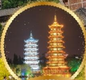
เจดีย์เงิน เจดีย์ทอง