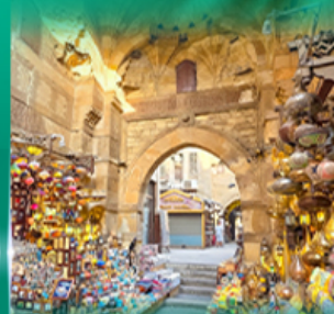
ตลาดผ่านเอลคาลีลี