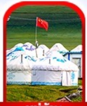
หมู่บ้าน พื้นเมือง