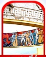
อนุสาวรีย์ โซซาน