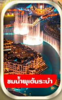
ชมน้ำพุเต้นระบำ

นั่งรถ 4WD ชมทะเลทรายอาหาร พร้อมทานดินเนอร์อาราเบีย