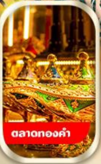
ตลาดทองคำ