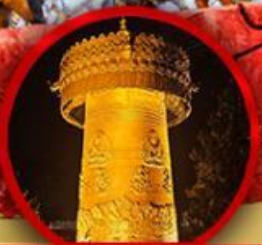
วัดต้าฝื่อ (ทงล้อทองคำ)