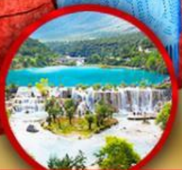
หุบเขาพระจันทรสีน้ำเงิน