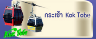
กระเช้า Kok Tobe