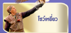
โชว์เหยี่ยว