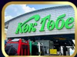
ซินโกกโทเบชอว์อัลมาตี

นั่งกระเช้าชิมบุลัก • ทะเลสาบโคลไซ • ชารินเกรนด์แคเนยอน