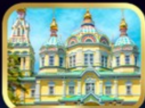
มหาวิหารเซนต์คอฟ อลมาตี