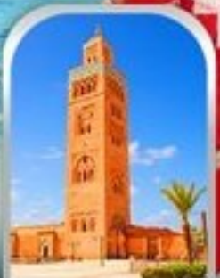
JEMAA EL-FNAA MARRAKESH