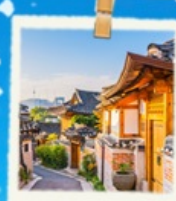
หมู่บ้านนูกซอน