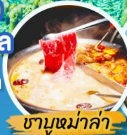
ชาบูหม่าล่า