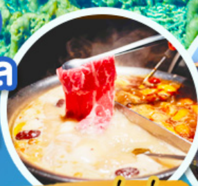
ชาบูหม่าล่า