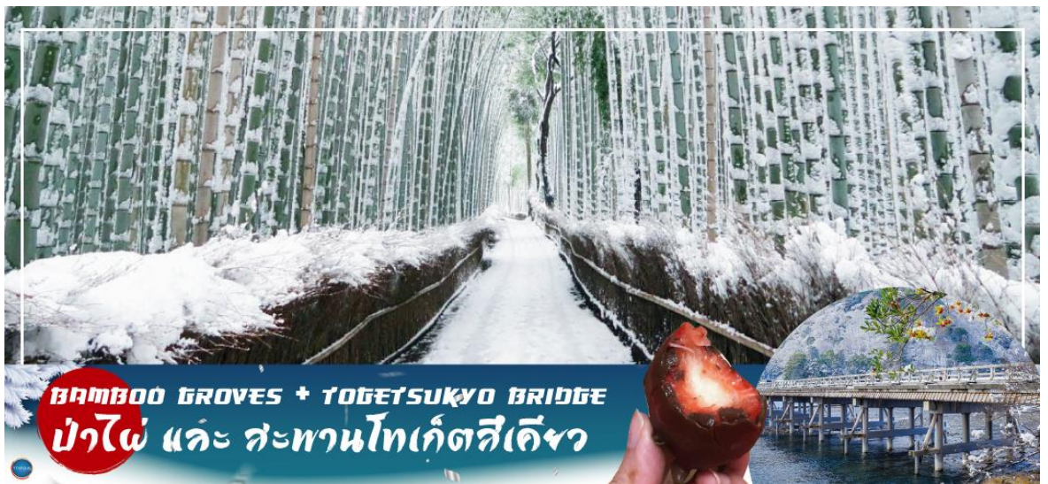
BAMBOO GROVES + TOGETSUKYO BRIDGE ป่าไผ่ และ สะพานโทเก็ตสึเคียว

เที่ยง รับประทานอาหารกลางวัน ณ ภัตตาคาร (4)