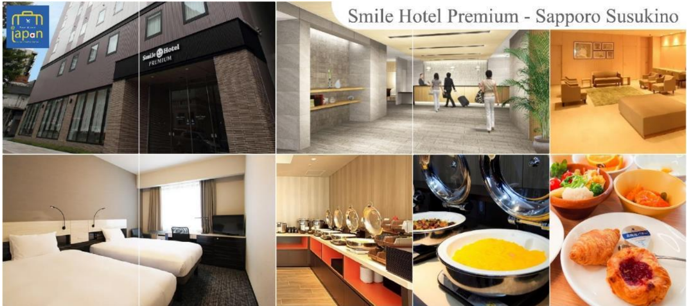
Smile Hotel Premium - Sapporo Susukino