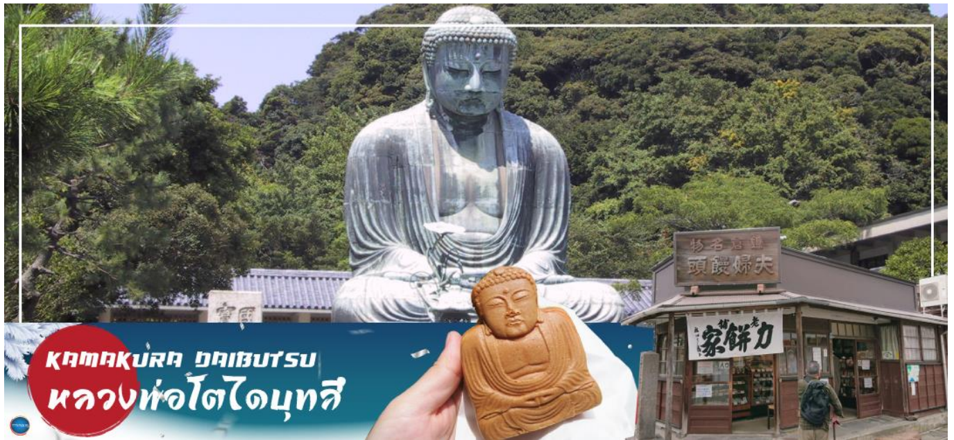
KAMAKURA DAIBUTSU หลวงพ่อโตไดบุทสึ

08.00 น. เดินทางถึง ท่าอากาศยานนานาชาตินาริตะ ประเทศญี่ปุ่น นำท่านผ่านขั้นตอนการตรวจคนเข้าเมืองและศุลกากร เรียบร้อยแล้ว ( เวลาที่ญี่ปุ่น เร็วกว่าเมืองไทย 2 ชั่วโมง กรุณาปรับนาฬิกาของท่านเพื่อความสะดวกในการนัดหมายเวลา) ***สำคัญมาก!! ประเทศญี่ปุ่นไม่อนุญาตให้นำอาหารสด จำพวก เนื้อสัตว์ พืช ผัก ผลไม้ เข้าประเทศ หากฝ่าฝืนมีโทษปรับและจับ