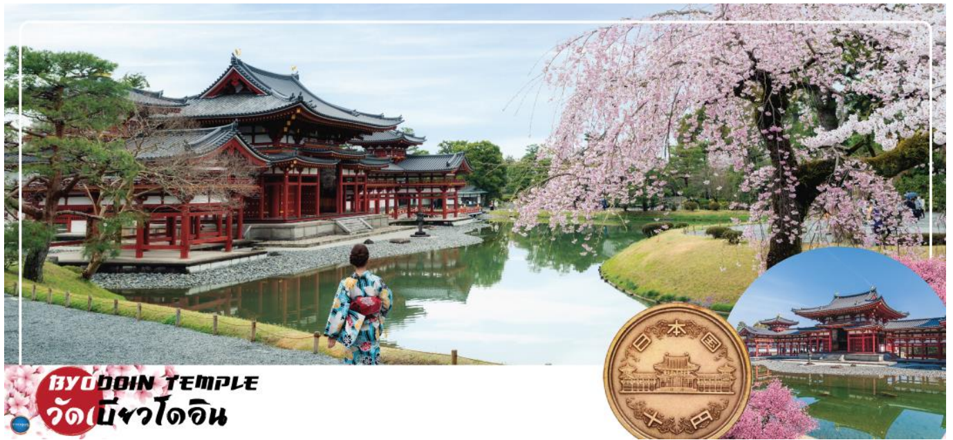
BYODOIN TEMPLE วัดเบียวโดอิน

วันที่สอง ท่าอากาศยานนานาชาติคันไซ โอซาก้า ประเทศญี่ปุ่น – เมืองเกียวโต – เมืองอุจิ – วัดเบียวโดอิน (จุดชมซากุระชั้นกับภูมิอากาศ) – ถนนเบียวโดอิน โอโมเตะซันโด (ถนนชาเขียว) – สะพานอุจิ – เมืองนาโกย่า – ขัอบึงย่านซาคาเอะ