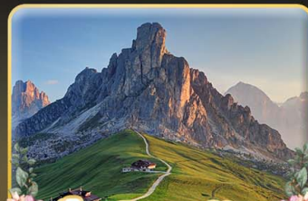
เขื่อน Passo Giau