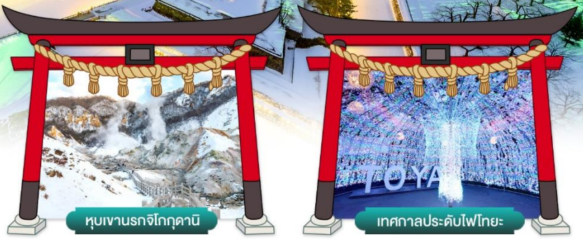
หุบเขานรกจิโกกุคานิ