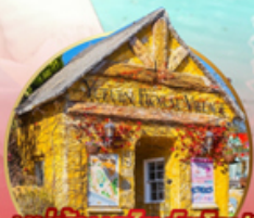
หมู่บ้านสไตลียุโรป! Yufuin Floral Village