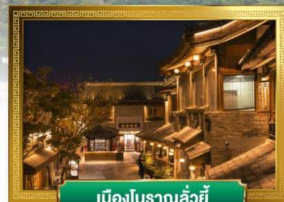
เมืองโบราณลั่วอี้