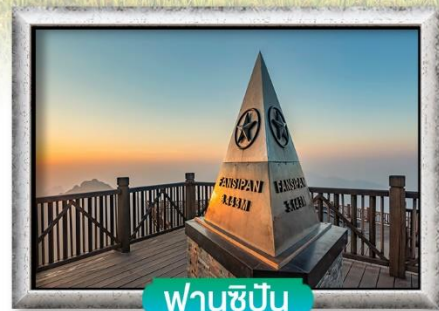
ฟานชีปัน