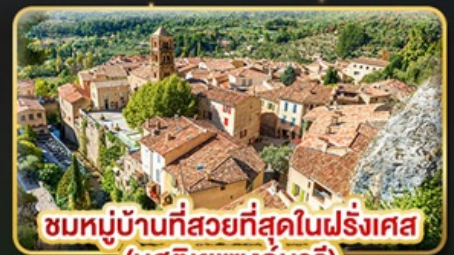
ชมหมู่บ้านที่สวยงามที่สุดในฝรั่งเศส (มูสติเยแซงท์มารี)