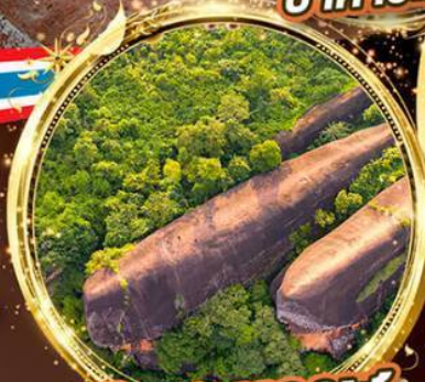
หินสามวาฬ