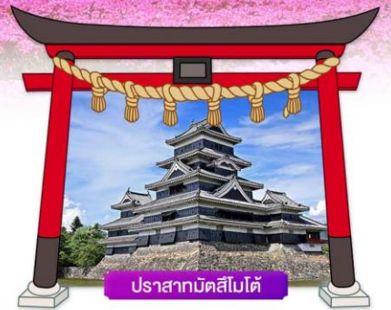
ปราสาทมัตสึโมโตะ