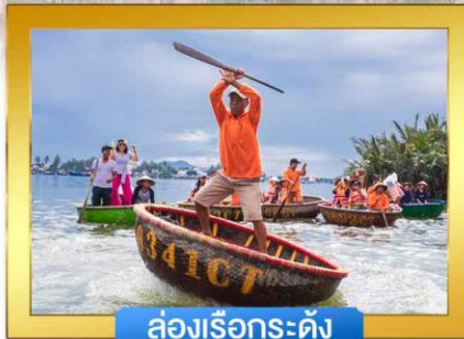
ล่องเรือกระดัง