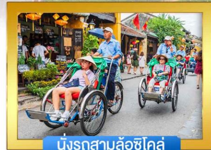
นั่งรถสามล้อชิโคล์