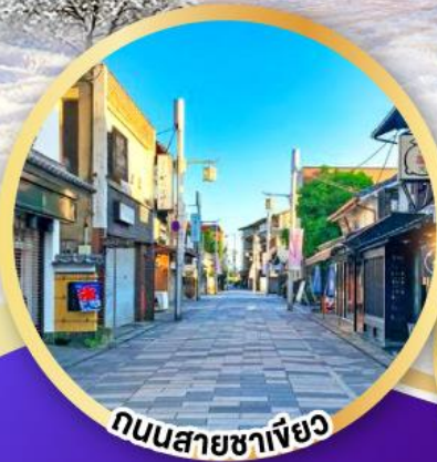
ถนนสายชาเขียว