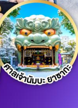
ศาลเจ้ามิมะ ยาชากะ